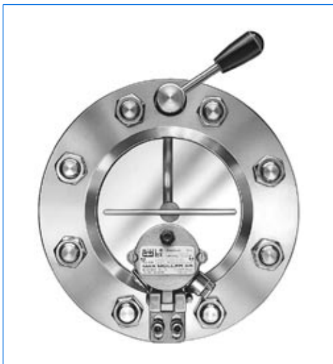
Scheibenwischer-System WS, eingebaut in eine VETROLUX®-Schauglasarmatur nach DIN 28120, DN 100, PN 10, mit auf der Armatur aufgebauter miniLUX®-Schauglasleuchte, Typ KVL 50 HDSch, 24 V, 50 W, für die Kombination «Licht und Sicht durch eine Armatur».