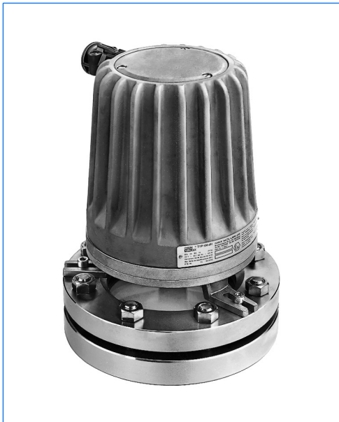
Hochleistungs-Schauglasleuchte Typ 100 deHN, 100 W, 24 V, Ex de IIC T4, Ex tD A21 IP65 T130°C, Ex II 2 G + D, mit Normfussbefestigung «N» montiert auf Schauglasarmatur nach DIN 28120, PN 10, DN 125

Die Hochleistungs-Ex-Modelle R 100 deH und 100 deH stellen die zur Zeit bezüglich ihrer jeweiligen Temperaturklassen-Einstufung leistungsstärksten Schauglasleuchten europäischer Fabrikation dar. Mit ihrem Einsatz erschliessen sich neue Dimensionen in der extrem lichtstarken Ausleuchtung verfahrenstechnischer Prozessabläufe. Rationellste Herstellung und grosszügige Lagerhaltung ergeben ein sehr günstiges Preis / Leistungs-Verhältnis und kurze Liefertermine.