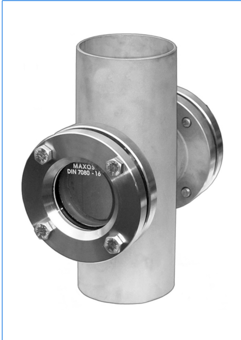
Durchfluss-Schauglasarmatur, Baureihe S-VA, Typ S-VA 80