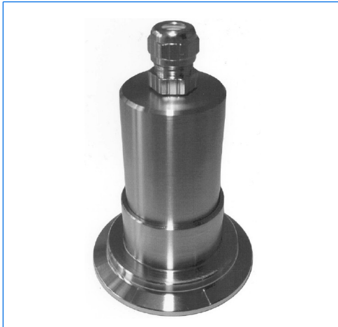
Micro-LED-Schauglasleuchte, Typ MVLR 2 LED, 2 W, 24 V AC/DC, auf metallverschmolzenem Schauglas für Triclamp® Klemmverbindungen, DN 50, PN 16