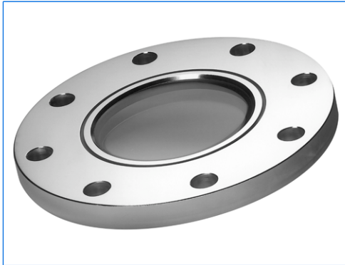
Schauglasflansch DN 150