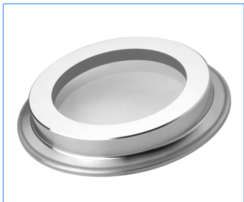
Schauglas für Klemmverbindung, Typ "Large View" (LV)