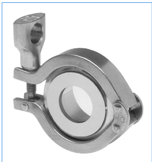
Schauglas mit Klemmverbindung, Typ "Standard View" (SV)