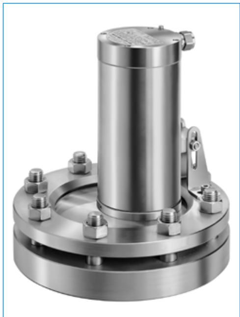
Projecteur type EdelEx 50 dH Sch K2, 50 W, 230 V, Ex d IIC T4, Ex tD A21 IP65 T130°C, Ex II 2 G + D, avec fixation par charnière «Sch» sur hublot rond selon DIN 28120, PN 10, DN 150.