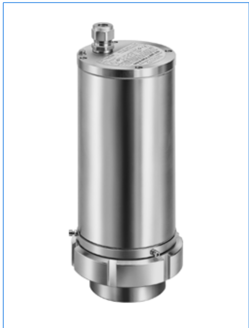
Projecteur type EdelEx G20 dH R 80 K1, 20 W, 230 V, Ex d IIC T5, Ex tD A21 IP65 T95°C, Ex II 2 G + D, avec fixation par disque à col étiré «R 80» sur hublot vissé similaire à DIN 11851, PN 6, DN 80.

Avec la gamme EdelEx G20 dH / 50 dH, MAX MÜLLER S.A. présente un produit de haute performance que vous, constructeur ou utilisateur d'appareils en INOX, avez attendu depuis des années! Mis à part son design sans compromis et la qualité réputée des produits de fabrication MAX MÜLLER S.A., les projecteurs de la gamme EdelEx vous offrent les principaux avantages suivants: