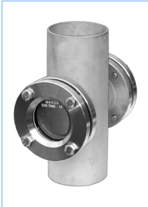
Contrôleur visuel de circulation, gamme S-VA, type S-VA 80