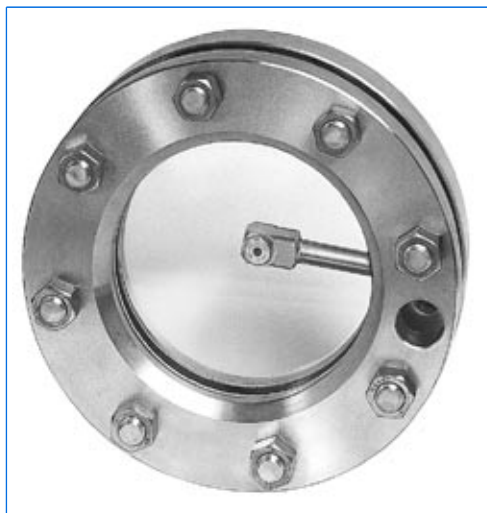
Lave-vitre type SV 4, monté dans un hublot similaire à DIN 28120, DN 125, PN 6.