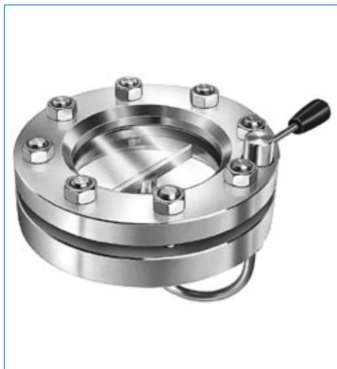
Essuie-glace, système WS, monté dans un hublot VETROLUX ® selon DIN 28120, PN 10, DN 100.