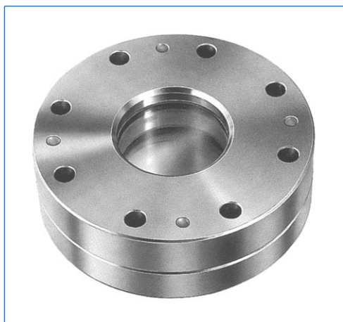
Hublot de sécurité à double vitrage similaire à DIN 28121, DN 125, PN 10