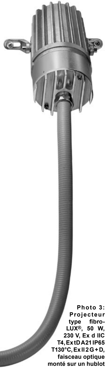
Photo 3: Projecteur fibre-optique VETROLUX®, 50 W, 230 V, Ex d IIC T4, ExtDA21 IP65 T130°C, Ex II 2 G + D, faisceau optique monté sur un hublot VETROLUX® selon DIN 28120, DN 25

fabrication sans problèmes de diverses zones à l'intérieur de l'appareil et de les illuminer de manière précise. Ça permet, par exemple, d'observer minutieusement des soudures lors de travaux d'entretien.