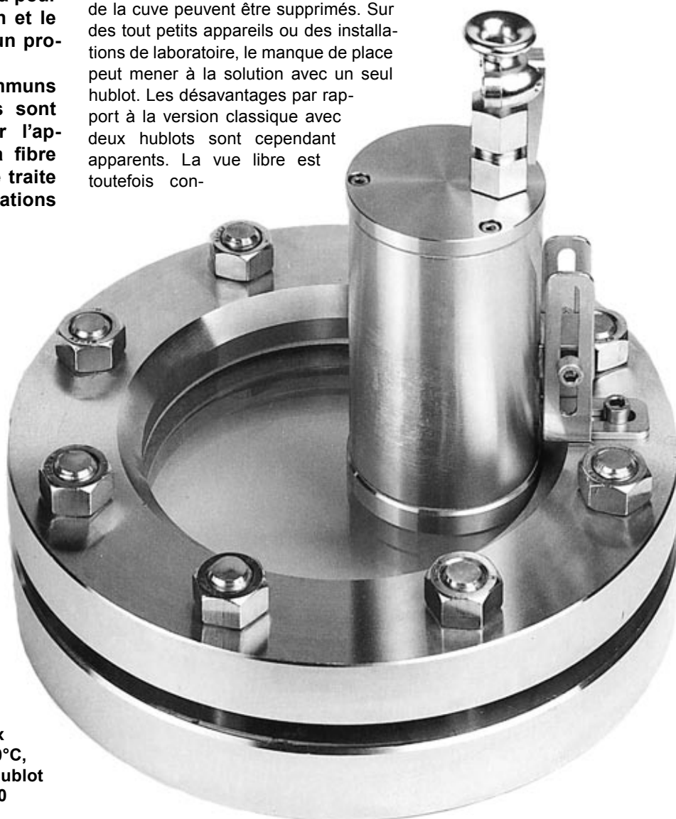
Photo 1: Projecteur type EdelEx 20dHSch, entièrement en INOX, 20 W, 24 V, Ex d IIC T4, Ex tD A21 IP65 T130°C, Ex II 2 G + D, monté sur un hublot VETROLUX® selon DIN 28120

sidérablement réduite et l'on risque des effets d'éblouissement indésirés qui ne peuvent être entièrement éliminés même avec l'option d'un pare-reflets. Si la lumière entre dans la cuve par un long ou étroit bout de tuyau ou par une