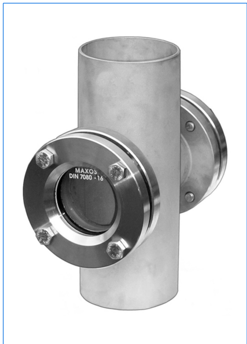
Contrôleur visuel de circulation, gamme S-VA, type S-VA 80