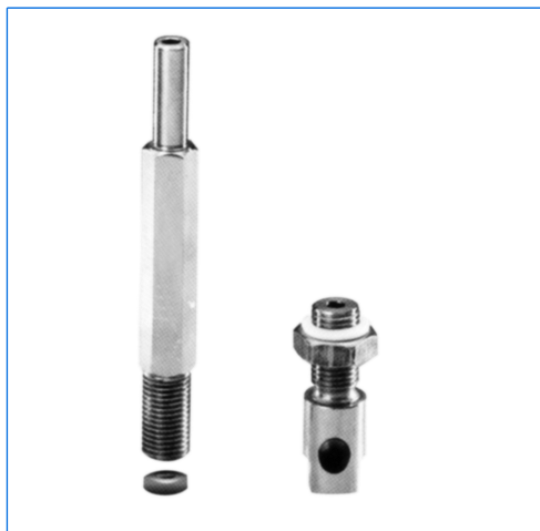
Lave-vitre de la gamme SVS