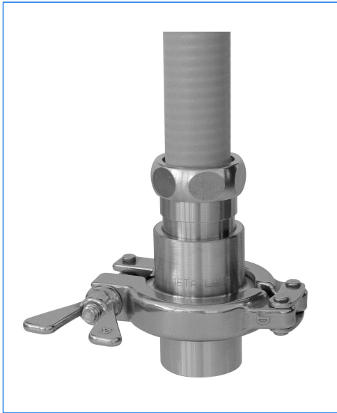
Hublot à verre moulé, 1", avec adaptateur et faisceau optique du projecteur à fibre optique gamme fibroLUX