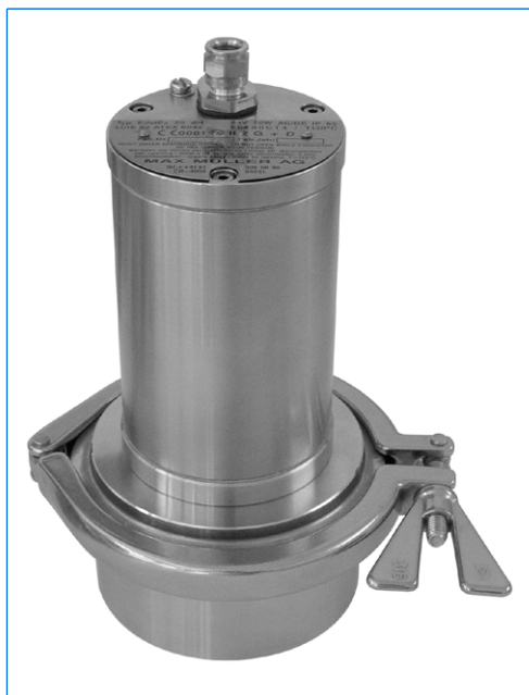
Projecteur type EdelEx STERI-LINE 20 dH, 24 V, 20 W, Ex d IIC T4, Ex tD A21 IP65 T130°C, Ex II 2 G + D, sur hublot à verre moulé, DN 100