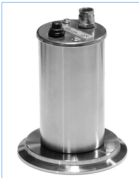
Proiettore tipo KLR 20 HDAsp, 20 W, 115 V, con pulsante incorporato «D», montato su un oblò con vetro sigillato per raccordi Triclamp, DN 100

Serie KLR A / KLR A LED in acciaio inossidabile per montaggio su oblò con vetri sigillati