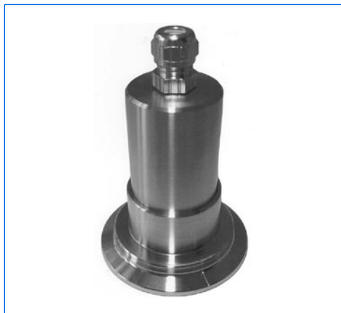
Micro-proiettore LED, tipo MVLR 2 LED, montato su oblò con vetro sigillato per raccordi Triclamp®, DN 50, PN 16