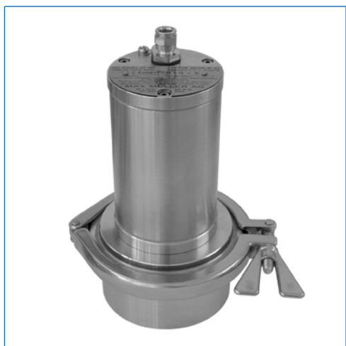
Proiettore LED EdelLUX, tipo EdelEx LED, Ex d II C T6, Ex tD A21 IP 65 T80°C, Ex II G + D, montato su oblò con vetro sigillato per raccordi Triclamp®, DN 50, PN 16