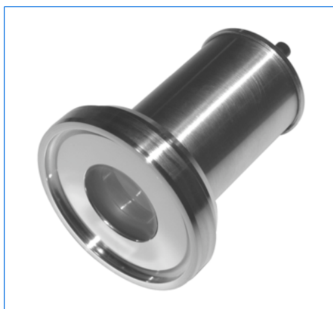
Proiettore LED miniLUX, tipo BKVLR LED, montato su flangia con vetro sigillato per applicazioni sterili