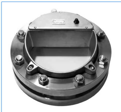
Proiettore LED metaLUX, tipo HL 200 LED, montato su oblò secondo DIN 2810, DN 200, PN 10

MAX MÜLLER S.p.A. osserva il sviluppo della tecnica LED da tanti anni e perciò offre un vasto spettro di proiettori per applicazioni in zone AD-PE o stagni. Le versioni LED offrono i vantaggi seguenti: