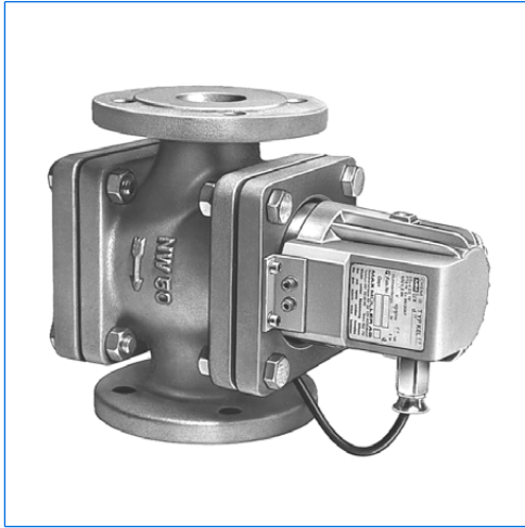
Spia visiva, tipo FDE 50, con proiettore tipo FKEL 5 dH WM, Ex d IIC T6, Ex tD A21 IP65 T80°C, Ex II 2 G + D, 230 V, 5 W, con vetro opalizzato «M»

Versione con flange secondo DIN e ANSI Serie FDG in ghisa grigia Serie FDS in ghisa acciaiosa Serie FDE in acciaio inossidabile