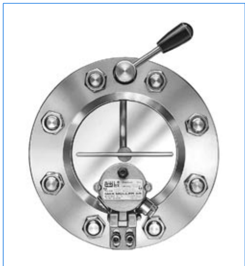
Tergicristallo, serie WS, montato in un oblo VETROLUX® secondo DIN 28120, DN 100, PN 10 con proiettore miniLUX®, tipo KVL 50 HDSch, 24 V, 50 W, in versione «vista ed illuminazione attraverso un oblo unico».