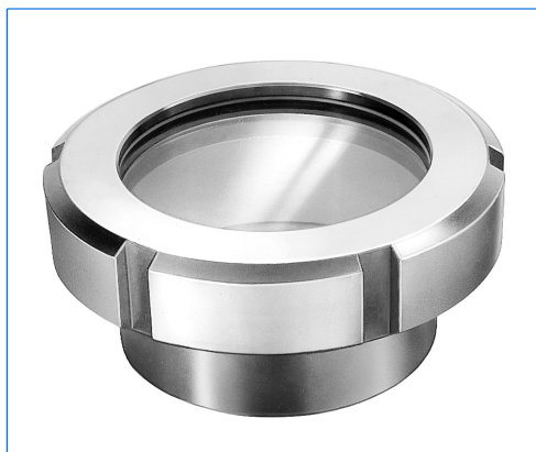
Oblò avvitato con bocchettone da saldare, tipo SSA 100