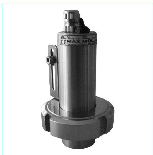
Micro-proiettore LED, tipo MVLR 2 LED, 2 W, 24 V AC/DC, con interruttore «marcia-arresto» «E» incorporato, montato su oblò avvitato VETROLUX similare a DIN 11851, DN 32, PN 6