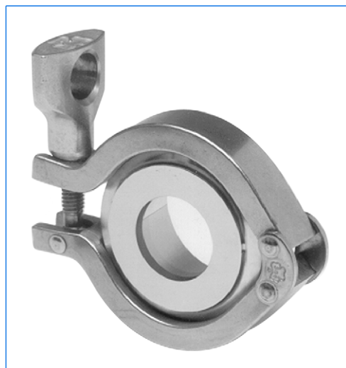
Oblò con raccordo Tri-Clamp, tipo «Standard View» (SV)