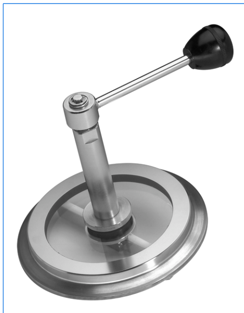
Oblò per raccordo Tri-Clamp con tergicristallo, serie WD